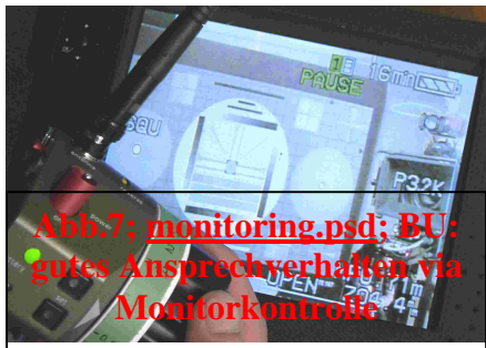
Abb.7; monitoring.psd; BU: gutes Ansprechverhalten via Monitorkontrolle

Professionelle Anforderung: Über Funkstrecke via