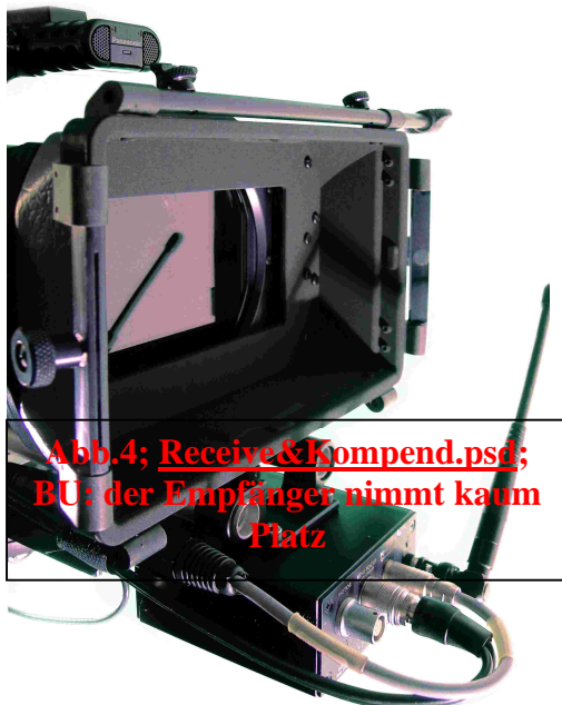
Abb.4; Receive&Komp.psd ; BU: der Empfänger nimmt kaum Platz

Die Montage der verschiedenen Teile folgt den Anforderungen des SteadyCam Systems. Die kleine Empfängereinheit nimmt kaum Platz.. An der Leichtstütze angebracht, direkt unter dem Kompendium lässt sie sich in Balance fahren. Und spricht mittels Kabelverbindung mit der HVX200; gespeist wird sie über den 12V Abgang des Flyers Ich wünschte mir einen Satz Rohrverlängerungen, um die Empfängereinheit als Konter hinter der Kamera zu positionieren.