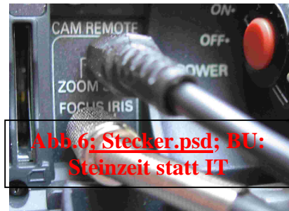
Abb.6; Stecker.psd; BU: Steinzeit statt IT

Fertig eingerichtet fásst sich schließlich alles gut an und mit der optimalen Gewichtsverteilung des Flyers schweben wir los. Der Flyer zeigt keine Deviationen und folgt meinen Flugversuchen gnadenlos! Entscheidender Vorteil des Systems ist schon jetzt die Gewichtsreduzierung bei voller Funktion.