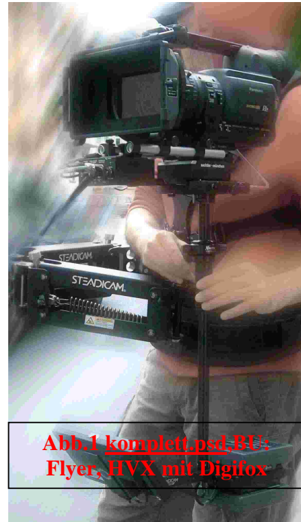
Abb.1 komplett.psd, BU: Flyer, HVX mit Digifox

Mit Blick auf die bewegte Kamera haben wir für den Test den Steadycam-Flyer ausgewählt: der kompakte aber