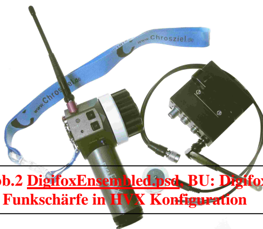
Abb.2 DigifoxEnsembled.psd, BU: Digifox Funkschärfe in HVX Konfiguration

vergleichsweise leichte Flyer bietet alle Vorzüge schwebender Kameraführung. Im Trio eingesetzt heißt unsere Strategie: „Drehen bei Offenblende,“ und steadycam-üblichen weiten bis mittleren Brennweiten. Zur Erinnerung: das von uns für den Test verwendete native 16:9 DVCpro50@25p Format in 1/3 Zoll Ausführung misst