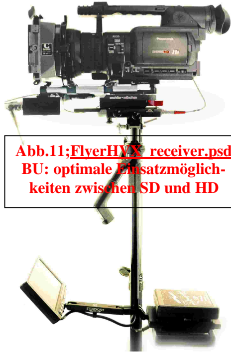
Abb.11; FlyerHVX_receiver.psd BU: optimale Einsatzmöglichkeiten zwischen SD und HD

nach Einsatz sollte dafür ein routinierter Operator bestellt werden. Dennoch bleibt für einfache Anwendungen das System auch „von der Stange“ leicht erlernbar. Abgekoppelt von der Steadycam sind die verschiedenen Teile breitbandig einsetzbar. Das HVX-Kit bietet mit Leichtstützenaufnahme und Kompendium die fehlende Ergänzung für studioähnlichen Bedingungen. Und die Digifox stellt sich bei dieser Gelegenheit als echtes Bindeglied für alle berechenbare Schärfenfragen zwischen Stativ und Kraneinsatz heraus: Denn sie stellt echte Anschläge zur Verfügung. Auch für aufgerüstete Anwendungen ist die Digifox ausgestattet. Alle Kamera – und Objektivtypen zwischen ENG und 35mm können motorisiert gefahren werden. Ein berechenbarer Einsatz der HVX im CloseFocus Bereich gelingt dann mit PS-Adapter, 35er Optiken und der Digifox. Der Flyer wurde freundlicherweise zur Verfügung gestellt von der Hamburger Firma XINETIX und wird über die Firma Chrosziel zum empfohlenen Netto-VK von rund 7300 € vertrieben. Das HVX Kit mit Leichtstütze, Kompendium und Frenchflag liegt bei 1320 €, die DIGIFOX in der HVX Konfiguration wird mit rund 5100 € empfohlen; Händlerpreise können abweichen.