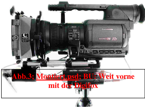
Abb.3; MontierL.psd ; BU: Weit vorne mit der Digifox

Bildwandlerebene. Die Einstellschärfe wird zwar bei Brennweitenwechsel gehalten. Aber mit Veränderung der Kameraposition unter Beibehaltung des Ausschnitts zeigen die Messungen eine Differenz von +/- 2,5cm zu der von uns markierten Bildwandlerebene an – oder einfacher: kritische Schärfen bei Offenblende sind für