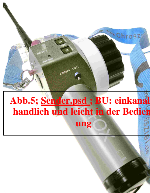
Abb.5; Sender.psd ; BU: einkanalig handlich und leicht in der Bedienung

mit der HVX. Die Fehleranalyse ergibt, dass die kameraseitigen Buchsen für LANC und FOCUS im Miniklinkenformat die Stecker nicht stabilisiert halten. Bezüglich dieser Verbindungen ist die Schnittstelle von IT und Film eher steinzeitlich ausgestattet. Aber Steinzeit hat ja gerade Konjunktur.